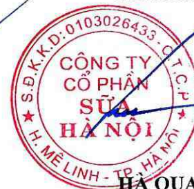
HÀ QUANG TUẤN